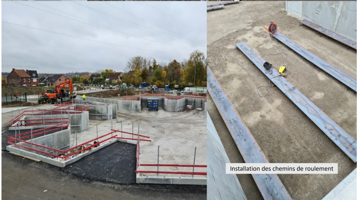
Installation des chemins de roulement