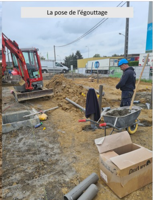
La pose de l'égouttage