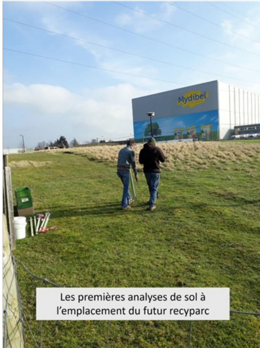
Les premières analyses de sol à l'emplacement du futur recyparc