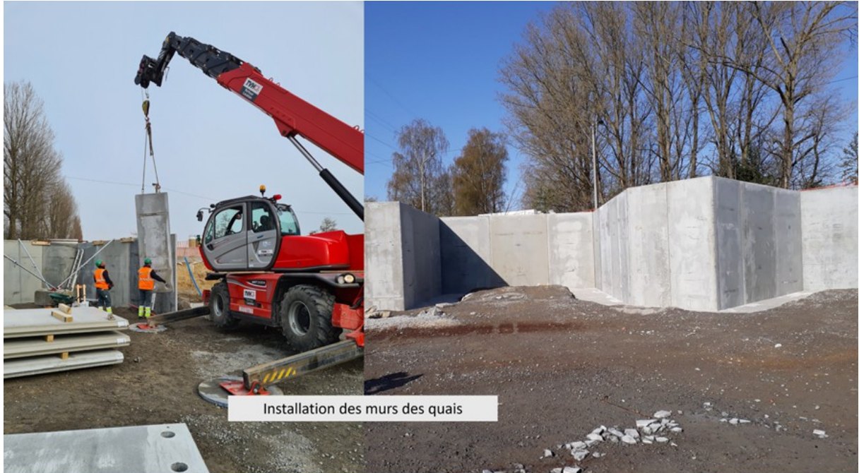
Installation des murs des quais